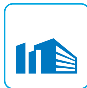
produttore di beni

nell'atto di inserimento nel contenitore " zerozerotoner " avviene un trasferimento di proprietà del rifiuto manlevando il cliente da qualsiasi responsabilità